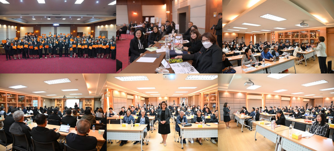
จริยธรรมของ มทส.

จำนวนผู้เข้าร่วม : 104 คน จาก 16 หน่วยงาน